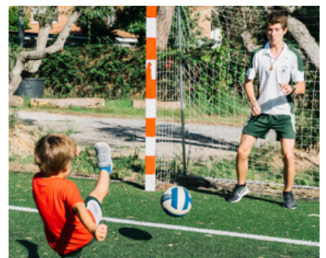
Fotos del Día del Deporte 2018